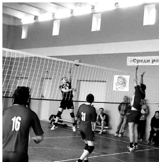
Эпизод волейбольного матча команд Петербурга и города Щёкино

Напомним, что соревнования «Спорт! Здоровье! Жизнь!» проходит в два этапа