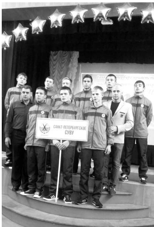
Три команды СПб СУВУ