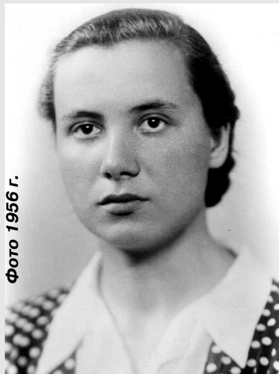
Фото 1956 г.