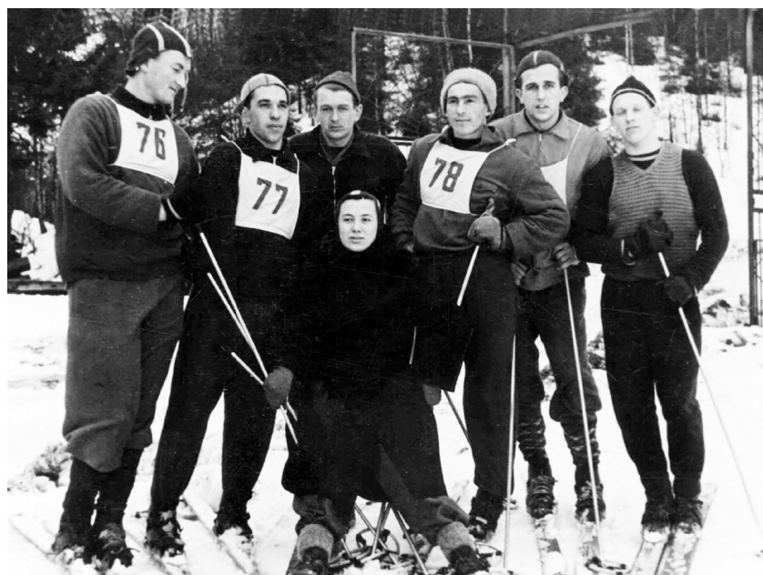
1957 г. – лыжные сборы студентов второго курса в Кавголово