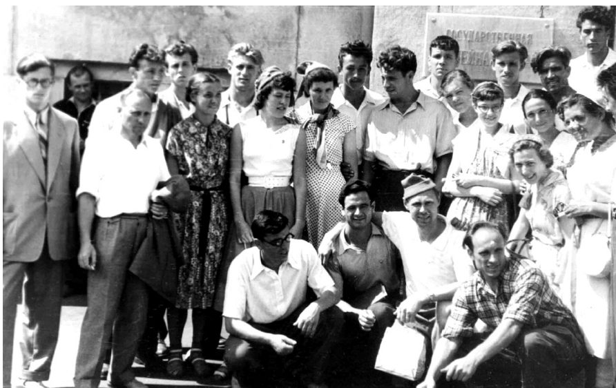
1957 г. – студенты-лесгафтовцы – на VI Всемирном фестивале молодёжи и студентов в Москве. Снимок на память вместе с участниками из других делегаций.