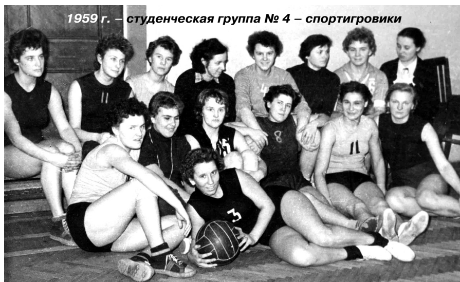
1959 г. – студенческая группа № 4 – спортистки

– Да, на момент окончания института нас было 144 выпускника. Из этого числа 15 человек во время Великой Отечественной войны пережили блокаду Ленинграда. На нашем курсе во вре-