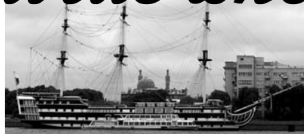
От шхуны «Благодать» началось путешествие семидесятилетних