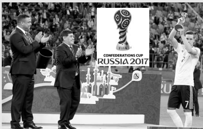
2 июля, стадион «Санкт-Петербург», Кубок конфедераций ФИФА. Звёзды мирового футбола – бразилец Роналдо и аргентинец Марадона поздравляют обладателя «Золотого мяча» Юлиана Дракслера.