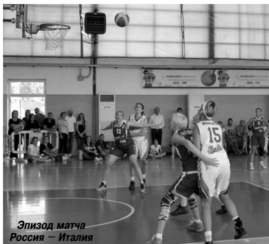
Эпизод матча Россия – Италия