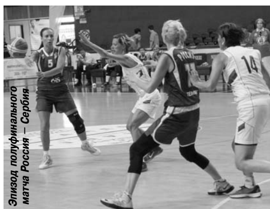
Эпизод полуфинального матча Россия – Сербия

Три победы – и мы в полуфинале, где нам снова бороться с Сербией за выход в финал. То, что мы выиграли у них игру в группе, не значило ничего. Предстояла игра через большое сопротивление, психологическое напряжение и физическую выносливость.