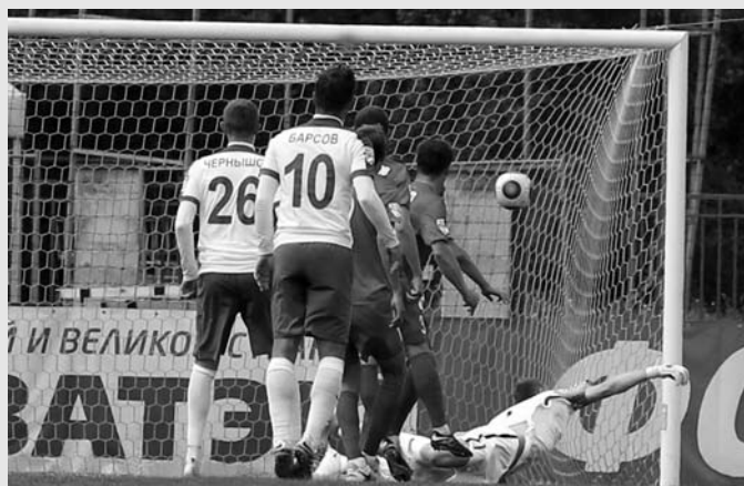
8 июля, малая арена СК «Петровский», ФОНБЕТ-первенство России. Эпизод победного (2:1) матча «Динамо-СПб» с красноярским «Енисеем».