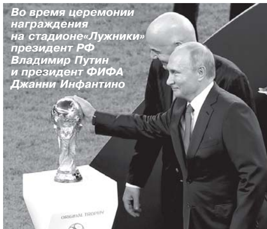
Во время церемонии награждения на стадионе «Лужники» президент РФ Владимир Путин и президент ФИФА Джанни Инфантино