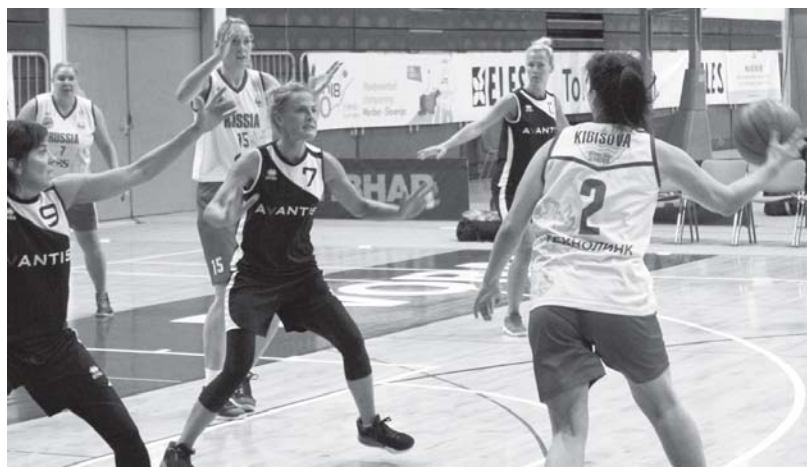
На верхнем снимке – эпизод финального матча СЗЛБЛ – «Авантис» (Латвия), на нижнем – эпизод встречи СЗЛБЛ – «Буске» (Марибор)

Женская сборная команда Северо-Западной любительской баскетбольной лиги (NWABL F35+), представляющая интересы ФСО профсоюзов «Россия», наконец-то завоевала свои первые золотые медали чемпионата Европы. До этого были серебряные награды: в 2010 году в