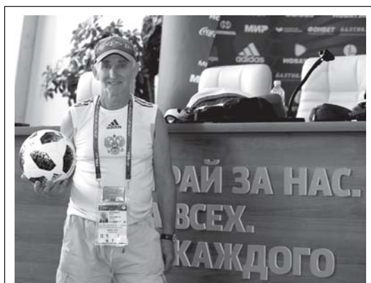
Фоторепортаж нашего спецкора Фёдора Кислякова на чемпионате мира-2018