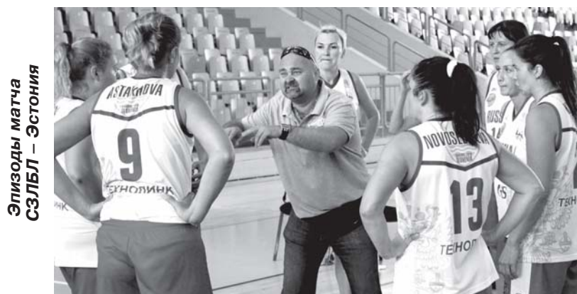
Эпизоды матча СЗЛБЛ – Эстония

ля и Брянска под знамёна сборной и поставив у руля профессионального тренера, удалось выставить на чемпионат Европы команду, которая была на голову сильнее соперников. В стартовой игре