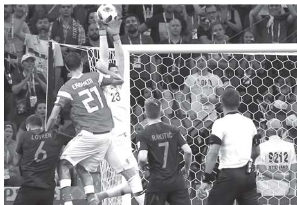
Сочи, 6 июля. Эпизод четвертьфинального матча Россия – Хорватия (2:2, 3:4)