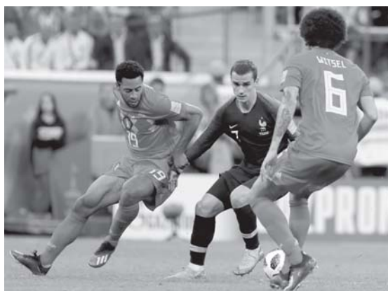
Петербург, 10 июля. Антуан Гризмманн (в центре) в полуфинальном матче Франция – Бельгия (1:0)