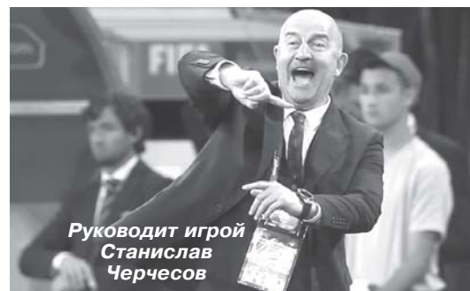
Руководит игрой Станислав Черчесов