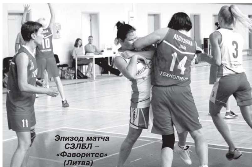
Эпизод матча СЗЛБЛ – «Фаворитес» (Литва)

С первого участия сборной команды СЗЛБЛ в чемпионате мира в чешской Праге в 2009 году, который проводила FIMBA, прошло девять лет. За