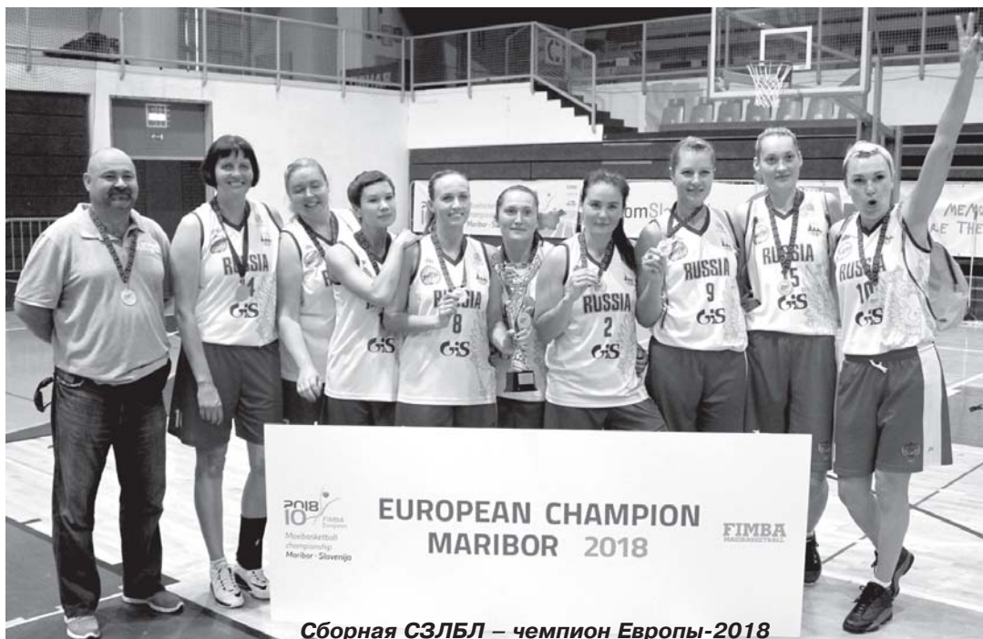
Сборная СЗЛБЛ – чемпион Европы-2018

чемпионата Европы наша команда более чем уверенно разгромила ровесниц из латвийского «Avantis» – 87:48. Были спокойно обыграны литовский «Favorites» – 65:42 и команда Эстонии – 75:55, которые находились в группе на 5 лет младше нас (F30+). Правда, игра с хозяевами чемпионата из нашей возрастной категории стоит особняком. Как ни пытались судьи вытащить этот