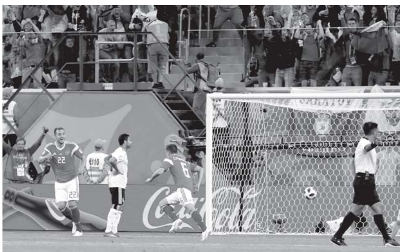
Эпизоды матчей группового турнира «А»: Россия – Египет (3:1) в Петербурге (19 июня) и Уругвай – Россия (0:3) в Самаре (26 июня)