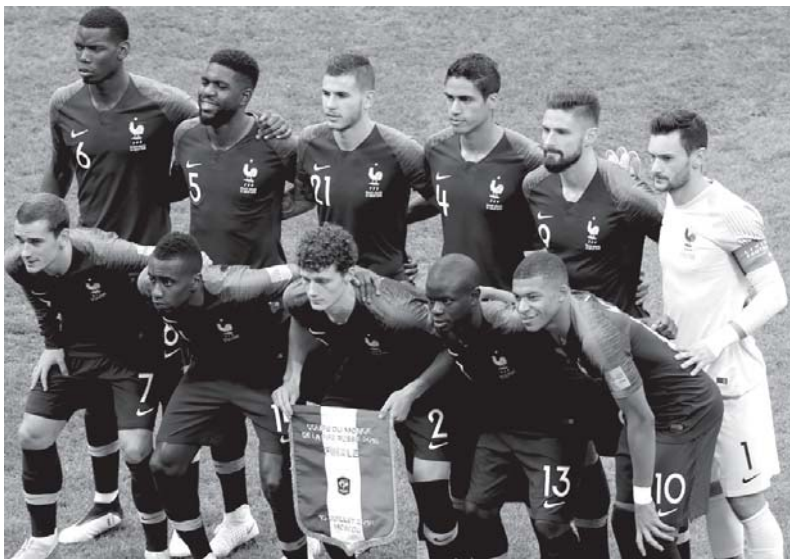
Сборная Франции – чемпион мира-2018, победившая в финале 15 июля на стадионе «Лужники» в Москве команду Хорватии (4:2)