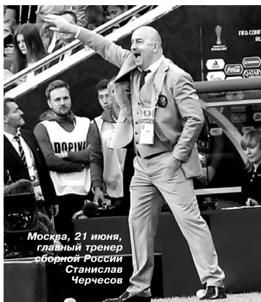
Москва, 21 июня, главный тренер сборной России Станислав Черчесов