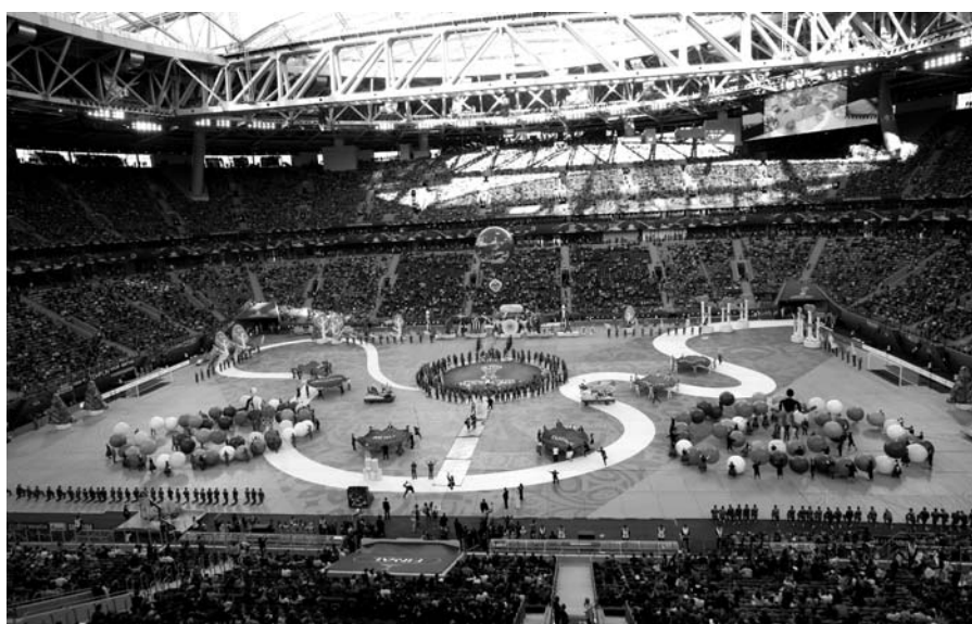
Церемония закрытия Кубка конфедераций на стадионе «Санкт-Петербург»