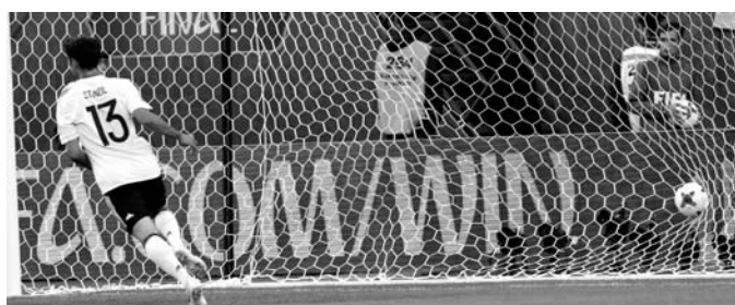
Голы сборной Германии в ворота команд Мексики (Сочи, 29 июня) и Чили (Петербург, 2 июля)