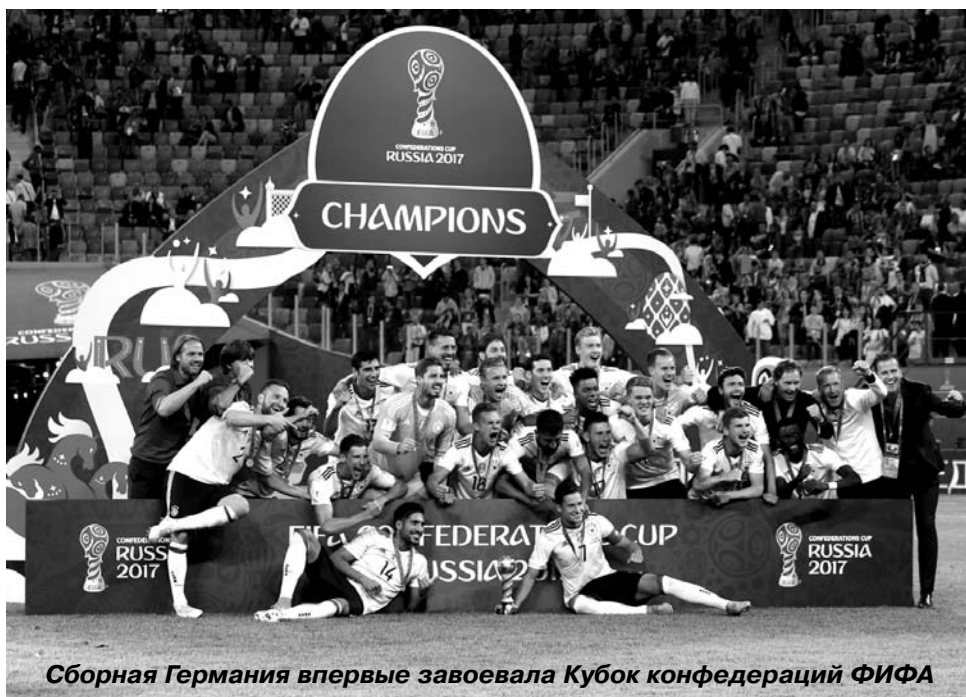
Сборная Германия впервые завоевала Кубок конфедераций ФИФА