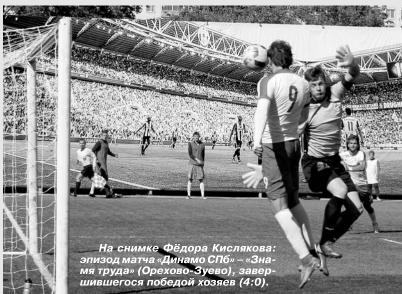
эпизод матча «Динамо СПб» – «Знамя труда» (Орехово-Зуево), завершившегося победой хозяев (4:0).

«Динамо СПб», завоевавшее путёвку в Фонбет первенство России среди команд ФНЛ, открывает новый сезон матчем с красноярским «Енисеем» на малой спортарене СК «Петровский» 8 июля. В этом месяце бело-голубые будут принимать в «родных стенах» воронежский «Факел» (22-го), волгоградский «Ротор» (26-го) и краснодарскую «Кубань» (30-го) и сыграют здесь же с «Зенитом-2» (15-го).