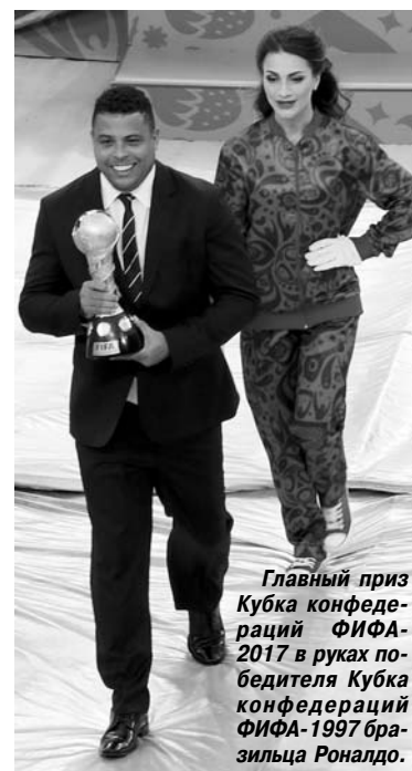
Главный приз Кубка конфедераций ФИФА-2017 в руках победителя Кубка конфедераций ФИФА-1997 бразильца Рональдо.