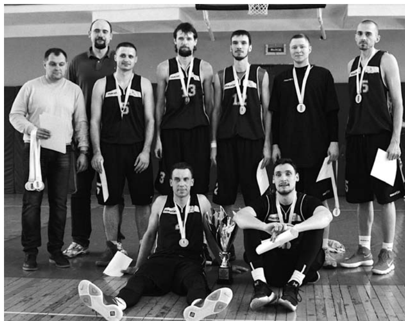
СК «Метрострой» – чемпион ФСО профсоюзов «Россия» –