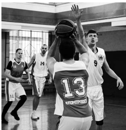
Эпизод матча «Атомпроект» — «Метрострой»