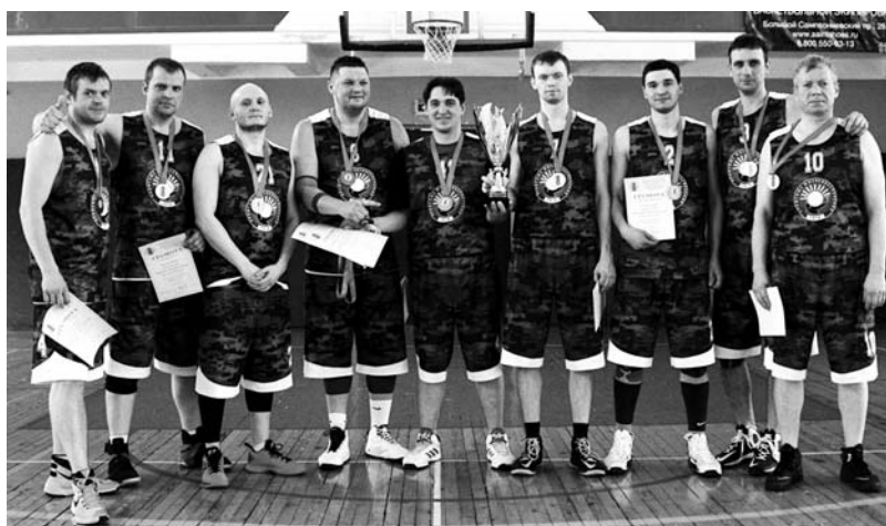
«Профсоюз Жизнеобеспечения» — бронзовый призёр чемпионата