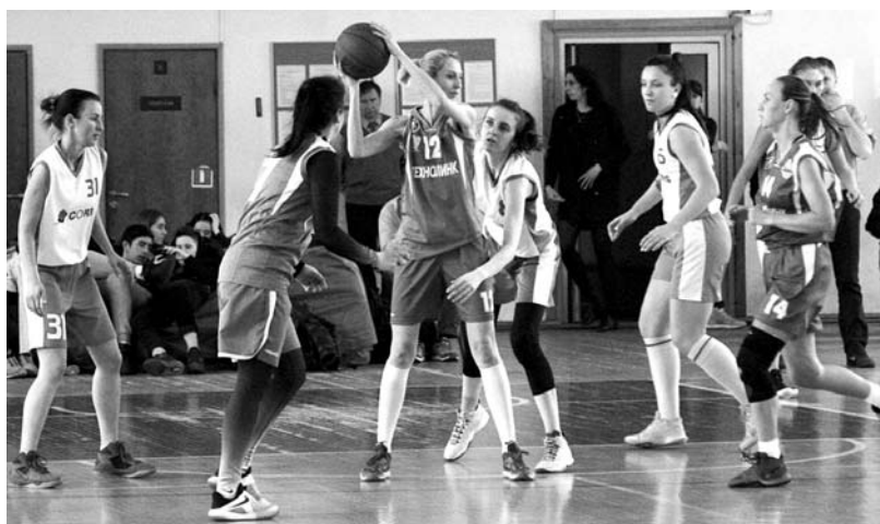
Эпизоды матчей: «ТЕХНОЛИНК» – «CORIS» (верхний снимок) и «Спарта» – «Банк России» (нижний снимок).