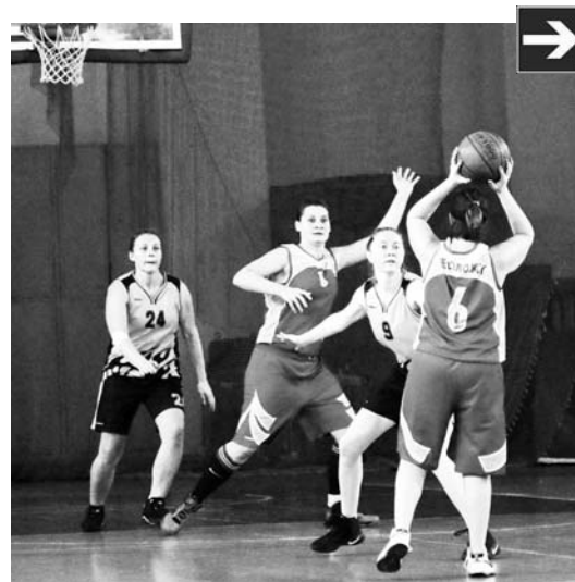
Эпизод матча «Бордо» – «Всеволожск»