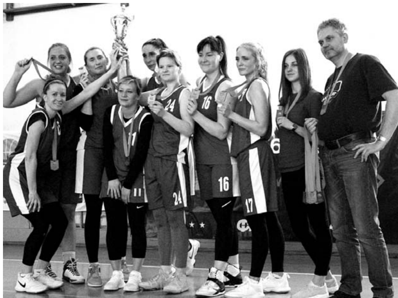
Бронзовый (верхний снимок) и серебряный призёры чемпионата; эпизод матча СПбГЭУ – «Всеволожск» (на нижнем снимке).