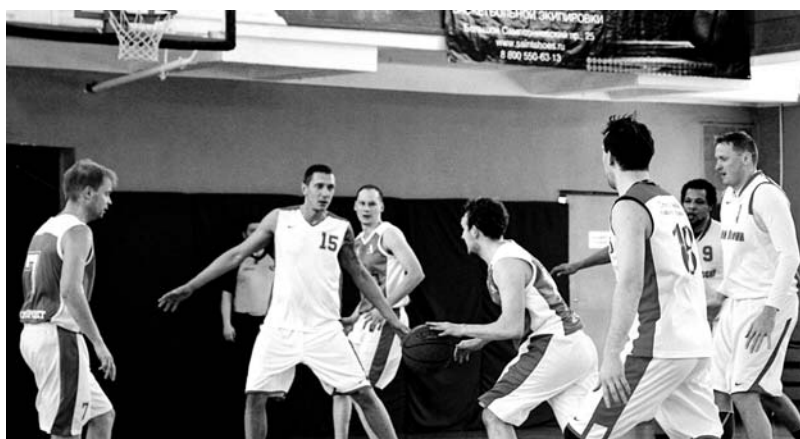
Эпизод матча «СЗГУ Банк» — «Атомпроект»