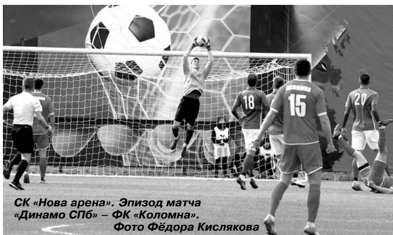
СК «Новая арена». Эпизод матча «Динамо СПб» – ФК «Коломна».