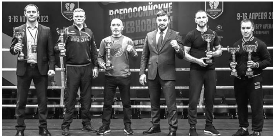
Окончание. Начало на 2-й стр.

Организаторы задали высокую планку турниру!».