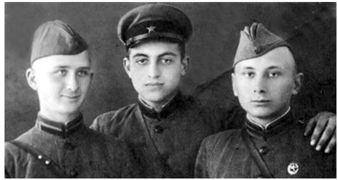
М.И. Эстерлис — с курсантами Орджоникидзевского военного училища связи, 1942 г.; с журналистами В.С. Набутовым и В.И. Семёновым на Дворцовой площади.

Особо хочется отметить, что один из старейших отечественных спортивных журналистов на протяжении многих лет публиковал очерки, репортажи, корреспонденции, интервью о профсоюзном спорте, о людях, трудившихся на промышленных предприятиях,