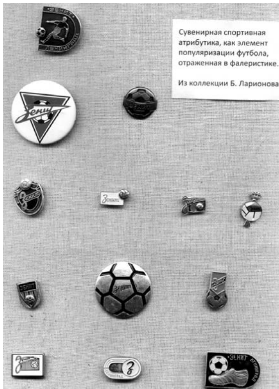
Сувенирная спортивная атрибутика, как элемент популяризации футбола, отраженная в фалеристике. Из коллекции Б. Ларионова.

В силу ограниченности газетной площади удаётся представить лишь малую часть из них.