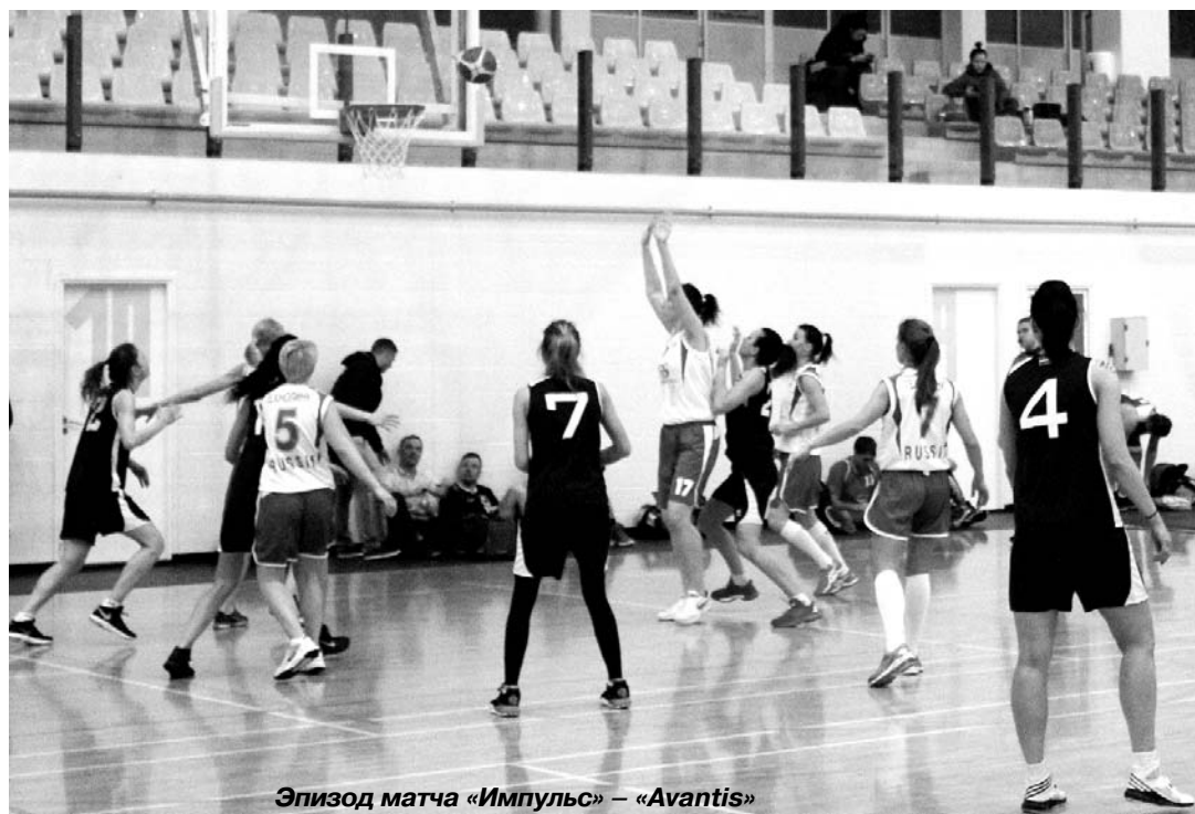
Эпизод матча «Импульс» – «Avantis»

делены на две четвёрки, которые в своих квартетах сыграли друг с другом в один круг. Итого каждая команда в субботу, 24 марта, провела по три игры – два тайма по 10 минут «грязного времени» в каждом матче.