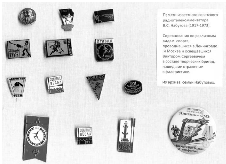
Памяти известного советского радиотелекомментатора В.С. Набутова (1917-1973).

Всё вышесказанное подтверждается представленными на очередном планшете знаками и значками. По воспоминаниям его сына К.В. Набутова — спортивного комментатора, телеведущего, продюсера: «отец вёл репортажи соревнований по лёгкой атлетике, футболу, волейболу, баскетболу, конному спорту, хоккею, лыжному спорту».