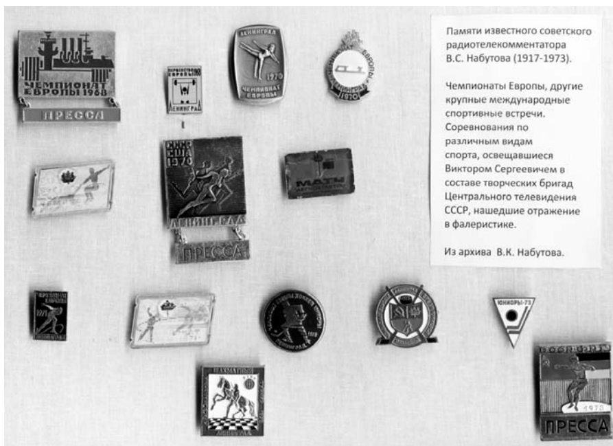
Памяти известного советского радиотелекомментатора В.С. Набутова (1917-1973).

Помешённые по годам на одном из планшетов значки практически совпадают с хронологией репортажей Виктора Сергеевича — с финалов I Спартакиады народов СССР (1956), международного лыжного пробега (1957), Спартакиады народов РСФСР (1959), международных соревнований по бегу (1968), хоккейных матчей (1967-1970), летней