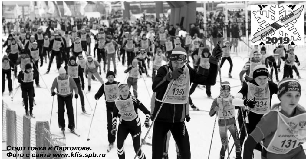
Старт гонки в Парголово.

Победители забегов получили кубки министерства спорта России и специальные призы от Комитета по физической культуре и спорту Ленинградской области. Призёры гонки были награждены медалями и дипломами министерства спорта РФ.