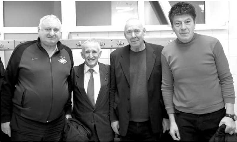
С легендарными в прошлом футболистами московского «Спартака» – Юрием Гавриловым, Олегом Романцевым и Ринатом Дасаевым