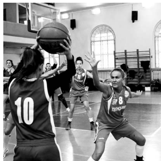
Эпизод матча «Банк России» – «ТЕХНОЛИНК»