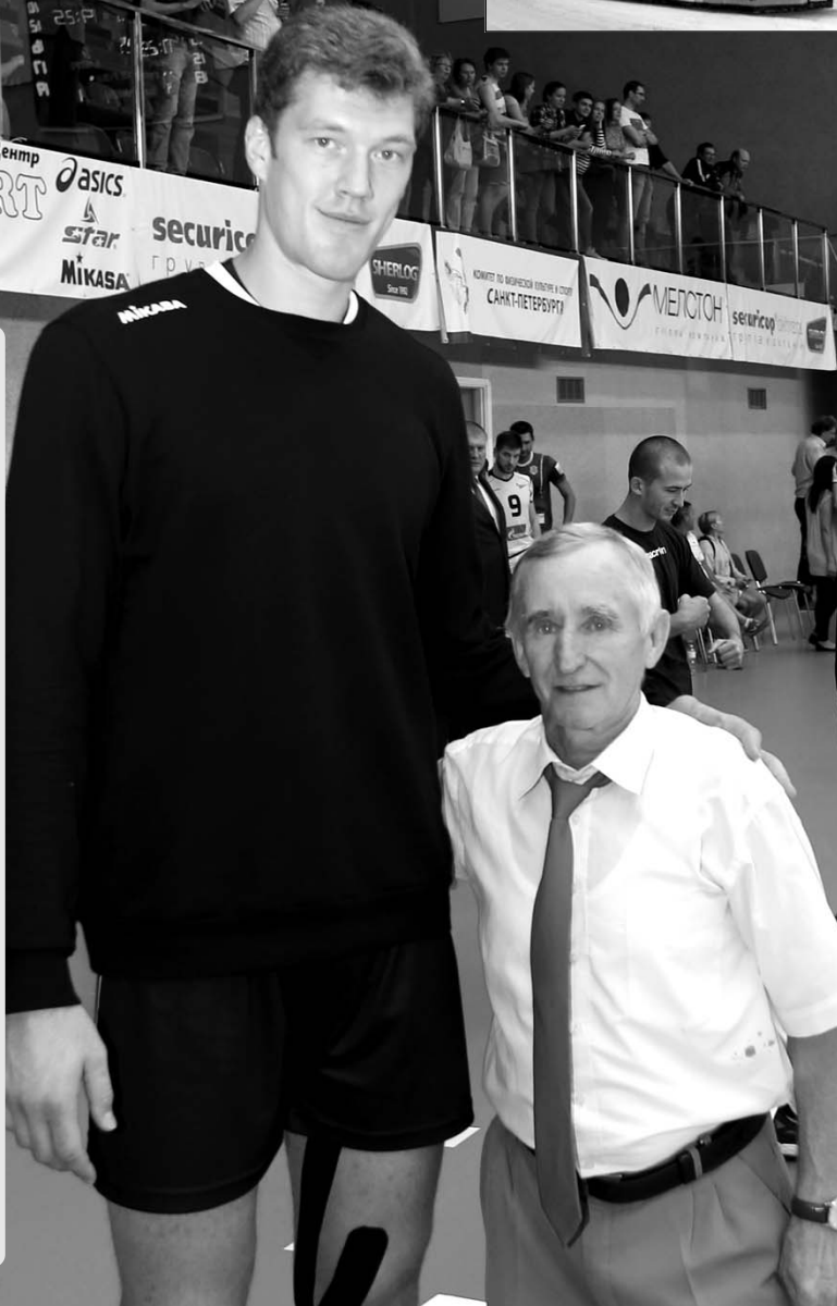
Фото 2017 года: 69-летний Фёдор Кисляков и 29-летний олимпийский чемпион по волейболу Дмитрий Мусэрский (рост 218 см)