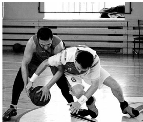
Эпизод матча «Ростелеком» – «Атомпроект»