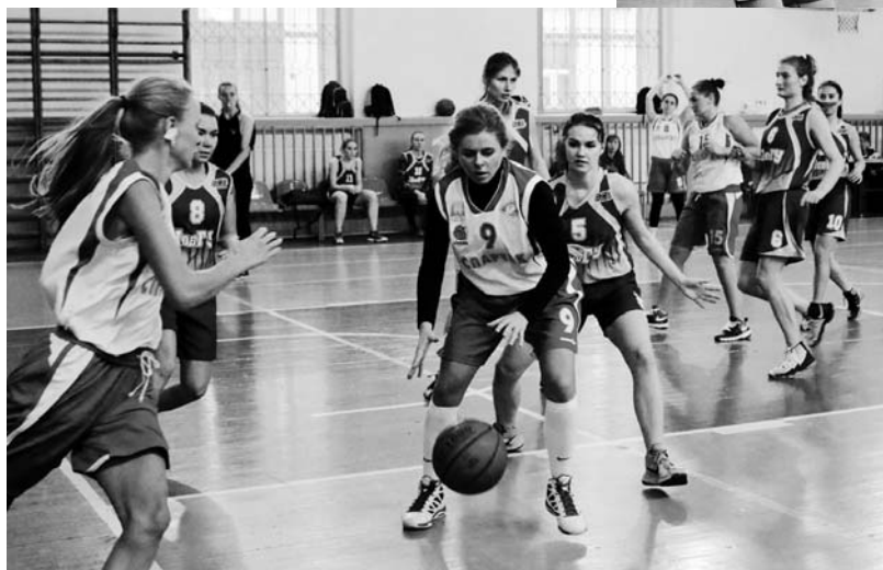
Эпизоды матча «Спартак» – «Спарта»

К прошлогодним участникам СЗЛБЛ – «ТЕХНОЛИНК», «CORIS», «Спарта» (Новгородская область), «Спартак» – в этом сезоне присоединились команды «Банк России», «Бордо», «СПбГЭУ» и «Всеволожск» (Ленинградская область).