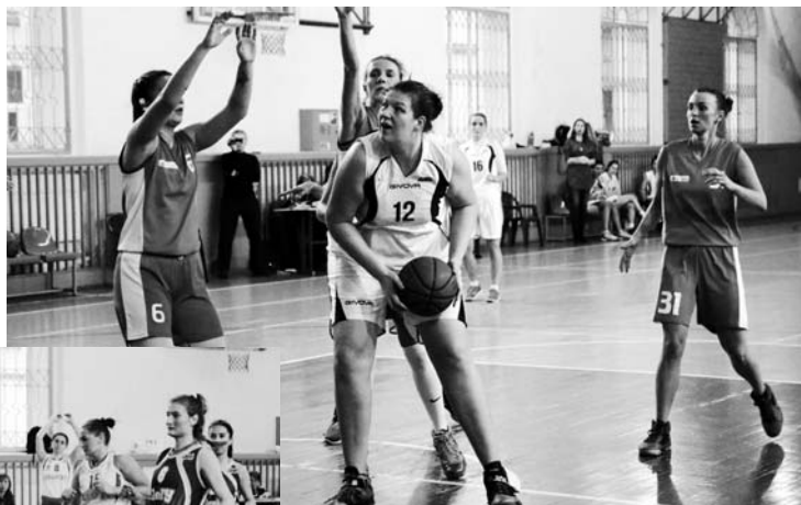
Эпизоды матча «CORIS» – «СПбГТУ»

В спортивном сезоне 2017-2018 годов Северо-Западная любительская баскетбольная лига подписала соглашение с Межрегиональной Любительской баскетбольной ассоциацией и проводит женский чемпионат Северо-Запада, в котором принимают участие 8 команд из Санкт-Петербурга, Великого Новгорода и Ленинградской области.