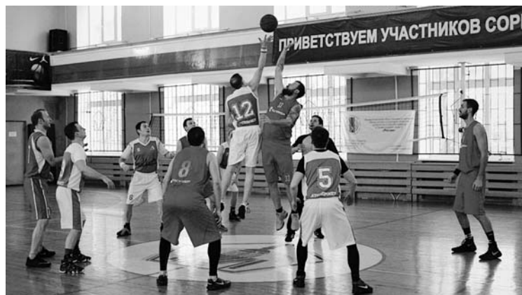
Эпизод матча «Ростелеком» – «Атомпроект»

Игры будут проходить в три круга каждый с каждым. Всего команды сыграют 45 матчей – 15 игр за сезон для каждой команды.