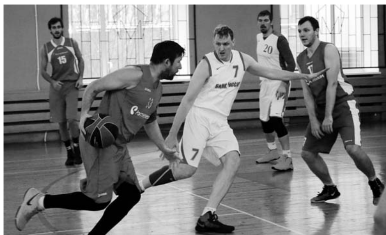
Эпизоды матча «Банк России» – «Ростелеком»