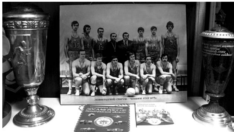
В музее ФСО профсоюзов «Россия»

– Во-первых, к 1987 году в рядах высшего руководства страны созрело решение упразднить «беготню» тренеров из одного спортивного общества в другое. Только у нас было 8 спортивных обществ, среди которых «Зенит», «Труд», «Буревестник», «Локомотив», «Спартак» и другие. Все нормальные тренеры десятилетиями работали в своих спортивных обществах и боролись за спортивный результат. А некоторые работали год в одном обществе, год – в другом, то есть как минимум на 8 лет такой тренер был обеспечен работой, а результата он не давал никакого. Во-вторых, считалось, что дорого содержать такие структуры. Помимо нас существовали (и существуют) «Динамо», Спортивный клуб армии, «Юность России». Кроме того, в Бе-