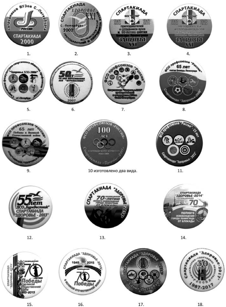
Хронологическая таблица изготовления значков к стартам спартакиад «Здоровье».

В 2002 году спартакиада «Здоровье» уже позиционируется как состязания «преподавателей и сотрудников вузов». Своеобразным де-