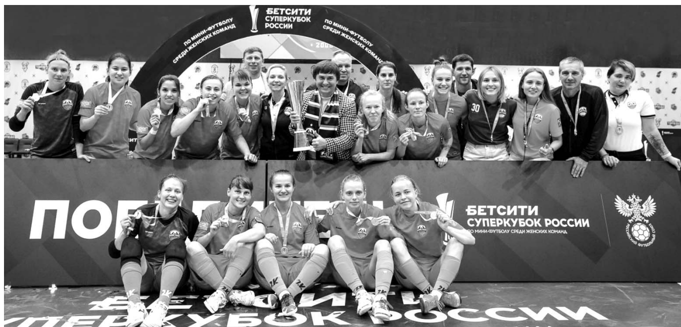
На снимке – женская мини-футбольная команда, завоевавшая 10 сентября в Нижнем Новгороде впервые проводимый Суперкубок России (со счётом 4:1 была обыграна местная Норманочка).