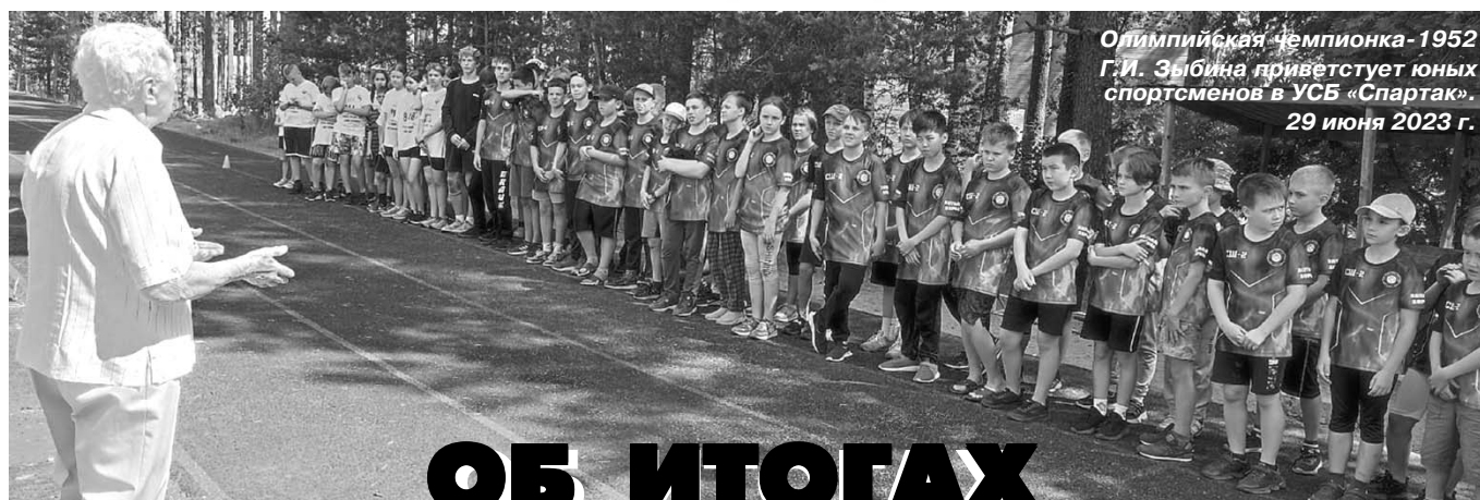
Олимпийская чемпионка - 1952 Г.И. Зыбина приветствует юных спортсменов в УСБ «Спартак». 29 июня 2023 г.