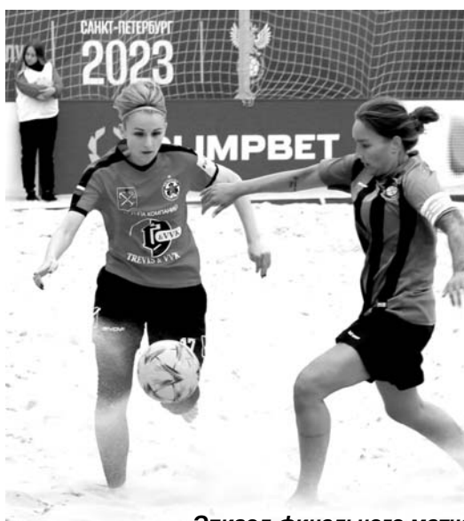
Эпизод финального матча