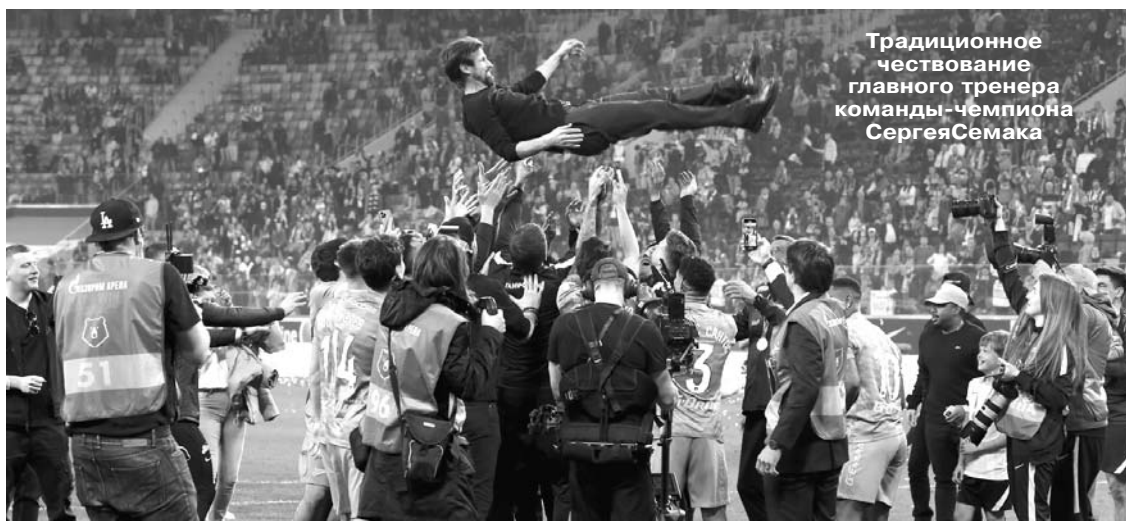
Традиционное чествование главного тренера команды-чемпиона Сергея Семака