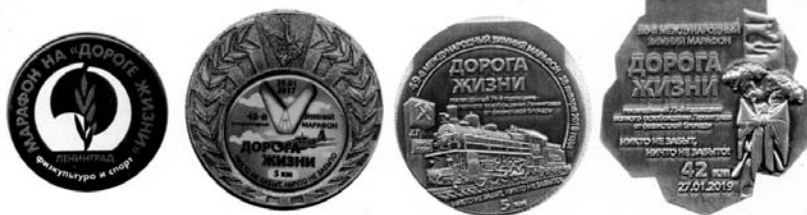
9. 10 аверс. 11- аверс. 12 аверс.

доход от распространения спортивной атрибутики, в том числе значков (илл. 16).