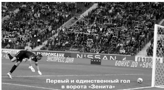
Первый и единственный гол в ворота «Зенита»