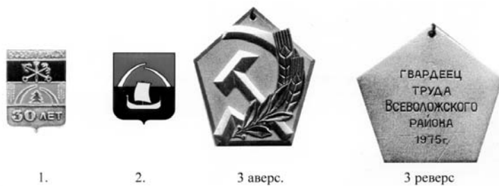
1. 2. 3 аверс. 3 реверс