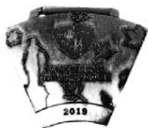
9 (аверс и реверс).