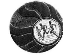
8 (аверс и реверс).