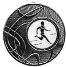
7 (аверс и реверс).