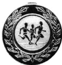
1 (аверс и реверс).

Отсутствие регламента, о чём упоминалось выше, привело к