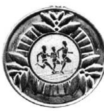
2 (аверс и реверс).