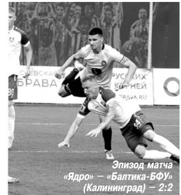
Эпизод матча «Ядро» – «Балтика-БФУ» (Калининград) – 2:2

тому, что и о медали диаметром 45 мм, выполненной к 38-му традиционному легкоатлетическому пробегу «Гатчина – Пушкин», состоявшемуся в 2008 году, нет никакой информации (илл. 4 – аверс и реверс).