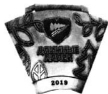
10 (аверс и реверс).