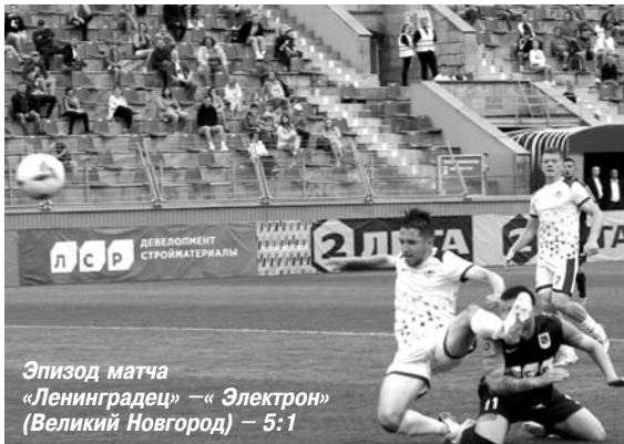
Эпизод матча «Ленинградец» – «Электрон» (Великий Новгород) – 5:1