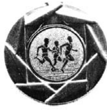
4 (аверс и реверс).