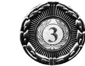
6 (аверс и реверс).