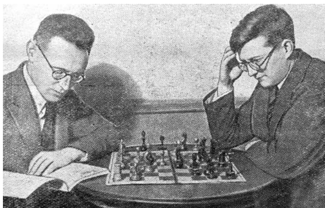
На репродукции из вузовской газеты: за шахматной доской – будущий чемпион мира Михаил Ботвинник и композитор Дмитрий Шостакович (31 мая 1941 г.).