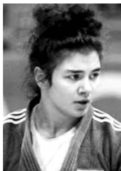
Мадина Таймазова (дзюдо)