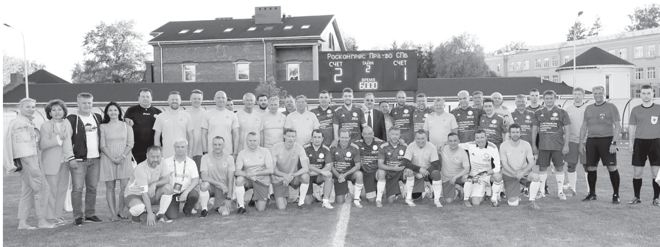
Команды городской администрации и Петербургского международного экономического форума – участники футбольного товарищеского матча на стадионе Павловского парка, завершившегося вничью – 2:2

22.05. Звезда-2005 Пермь – Зенит – 0:1. 29.05. Зенит – ФК Краснодар – 2:1. ЦСКА Москва – Зенит – 2:0.