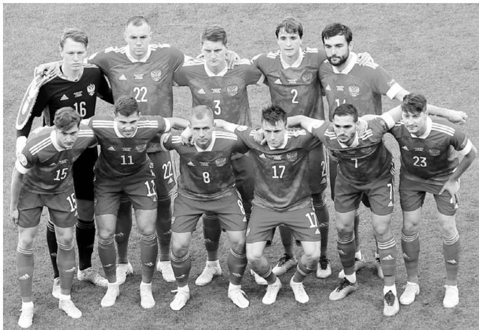
Эпизоды матча сборных России и Финляндии, принесший победу хозяевам поля – 1:0