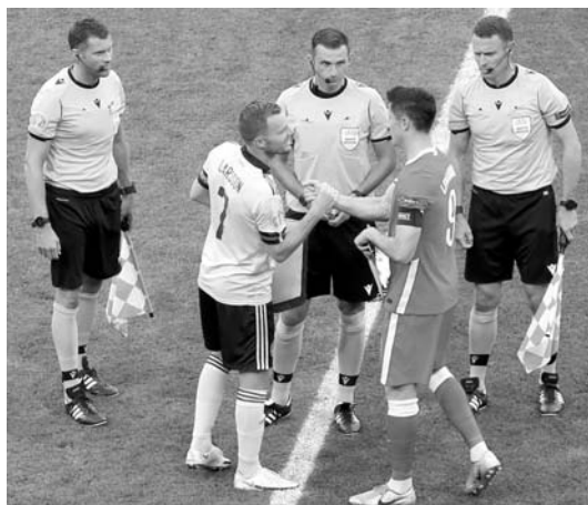
Эпизоды матча сборных Швеции и Польши – 3:2