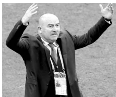
Репортаж нашего спецкора Фёдора Кислякова с ЕВРО-2020