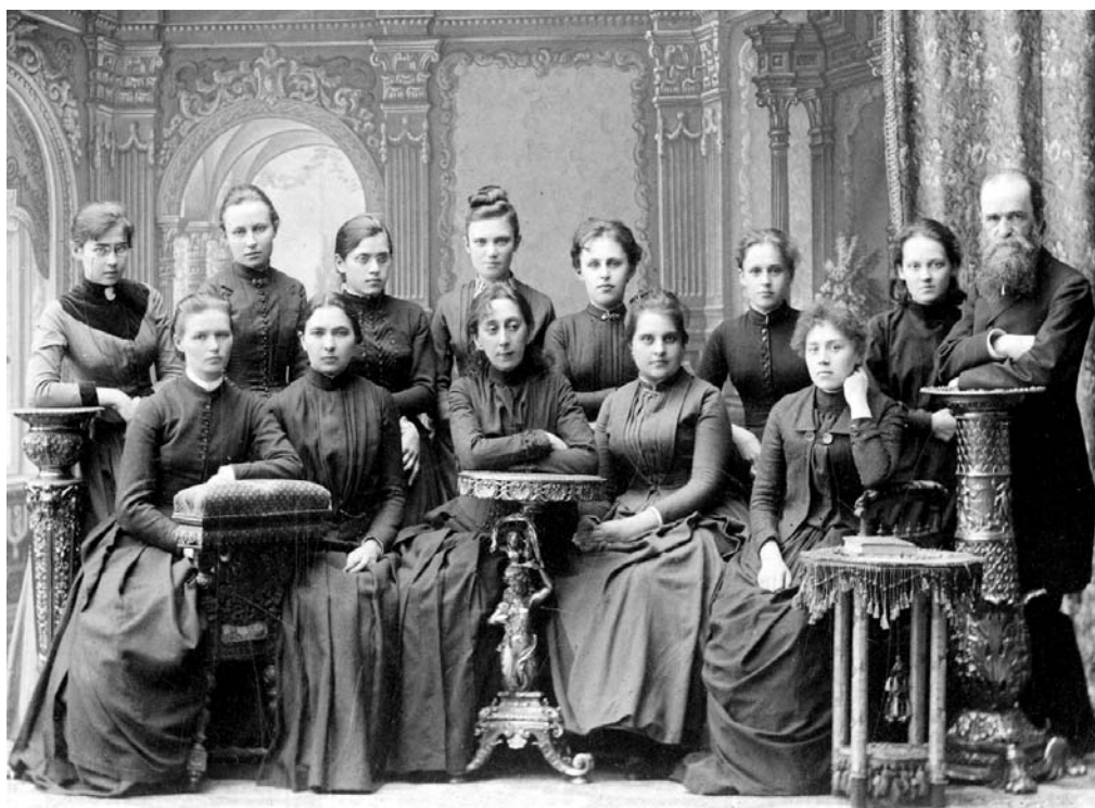
П. Ф. Лесгафт со слушательницами Высших курсов воспитательниц и руководительниц физического образования. 1897 год

люди активные, успешные, творческие, сильные, целеустремлённые, прославлявшие и прославляющие вуз во многих уголках страны и на разных континентах. Выпускники университета трудятся в вузах, средних специальных заведениях, общеобразовательных и спортивных школах, обществах, федерациях, коллективах физической культуры, спортивных клубах, больницах, клиниках, структурах управления отраслью. Лесгафтовцы успешно работают тренерами сборных команд, руководителями всероссийских и международных формирований, организуют масштабные спортивные мероприятия. Большая плеяда выпускников вуза добилась ярких побед на Олимпийских играх, Всемирных университетах, чемпионатах мира, Европы, России. Лесгафтовцы выступали в составах команд спортивного клуба вуза, ЛОС ДСО «Буревестник», ФСО профсоюзов «Россия», других спортивных обществ и ведомств, сборных города, страны. Более 300 человек стали заслуженными мастерами спорта. Свыше 500 выпускников являются заслуженными тренерами по видам спорта. Востребованность лесгафтовцев на рынке труда стабиль-