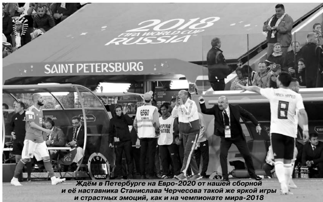
Ждём в Петербурге на Евро-2020 от нашей сборной и её наставника Станислава Черчесова такой же яркой игры и страстных эмоций, как и на чемпионате мира-2018