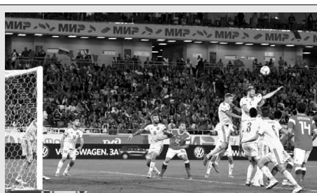
9.09.2019, Калининград. Эпизод квалификационного матча к Евро-2020 сборная Россия — сборная Казахстан — 1:0.