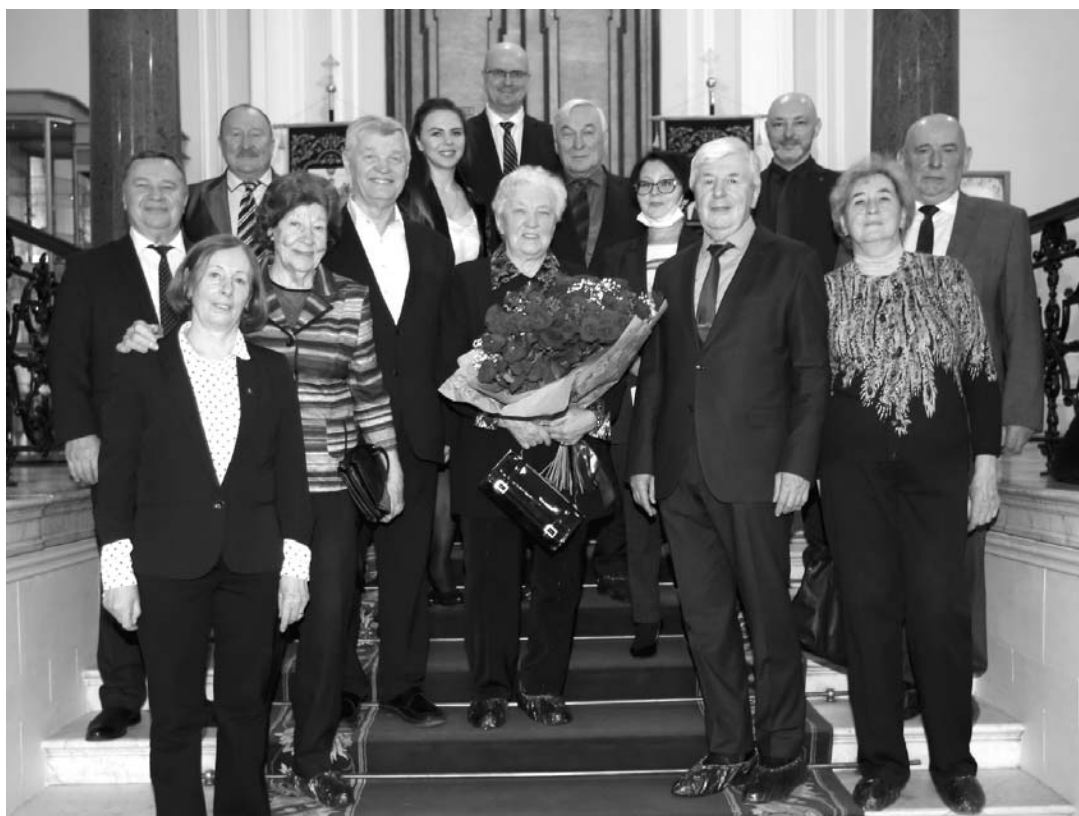
рис Пиотровский передал поздравление от губернатора Санкт-Петербурга Александра Беглова: «Ваши незабываемые победы и триумфы на самых престижных международных соревнованиях, работоспособность и целеустремлённость по сей день являются значимым примером для молодых атлетов. Вы впервые в истории нашей страны завоевали золотую медаль Олимпийских игр в толкании ядра. Эти победы являются значимой частью российского спорта и, несомненно, укрепили авторитет отечественной школы лёгкой атлетики».