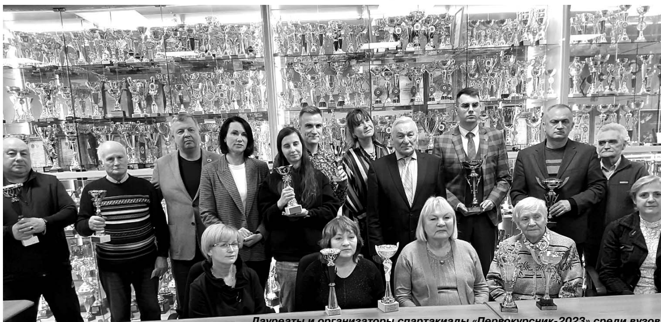
Лауреаты и организаторы спартакиады «Первокурсник-2023» среди вузов