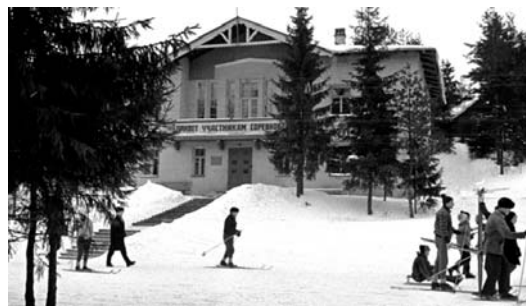
Кавголово, лыжная база «Строитель» 19-го стройтреста. Предположительно 1969 год.

В Главленинградстрое в то время работал начальником отдела физ-