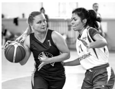
Эпизоды матчей «Victory» – «ТЕХНОЛИНК», «Банкирши» – «Спартак» (справа)

В начале ноября стартовал женский чемпионат Межрегиональной любительской баскетбольной лиги «СЕВЕРО-ЗАПАД»