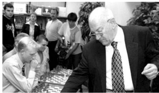
В.Л. Корчной даёт сеанс одновременной игры

Думаю, он просто куда-то спешил, потому что к тому времени я уже был без пешки, и конечно, он бы меня дожал. Хотя у меня тоже был шанс. У меня активно расположен король. Его три пешки изолированы, а мои расположены на полях одноимённого слона.