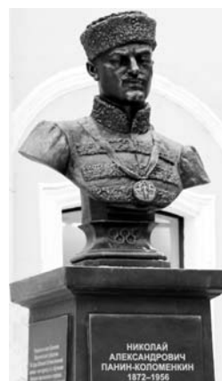
Бюст первого русского олимпийщика

вуза. Волонтерское движение из числа студентов, аспирантов и молодых ученых ведёт большую работу с населением, апробируя на практике спортивно-оздоровительные и рекреационные методики кафедр, пропагандируя спорт и здоровый образ жизни.