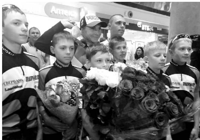
На снимке с сайта www.lenobl.ru : серебряный олимпийский призёр по велоспорту Ольга Забелинская с юными гонщиками в аэропорту «Пулково».

Созданный общественностью Олимпийский совет (точное название Совет содействия развитию спорта высших достижений), изначально сформиро-