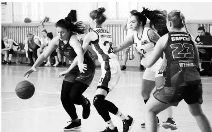
Эпизод матча «Кронверкские барсы» – РГПУ