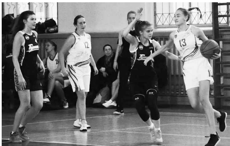
Эпизод матча ГУТид – «Всеволожск»