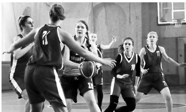
Эпизод матча «Банк России» – «Старта-НовГУ»