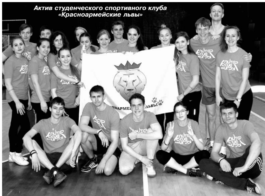
Актив студенческого спортивного клуба «Красноармейские львы»

Деятельность кружка физкультуры в институте в 1927 г. отмечалась так: «С окончанием зачетной горячки по инту кончилась и временная текущая в составе кружков физкультуры. В данный период кружок обслуживает до 300 человек студенчества: по секциям гимнастич., лыжная, баскет-бол, бокс, тяж. атлет. Всё время студенчество было удовлетворено льготными абонементом на катки. Двух опытных методистов-конструкторов в силу обстоятельств пришлось заменить молодыми инструкторами, потому что бюро кружка в данный период должно обратить внимание на руководство методической работой. В области физвоспитания был проведено две лекции по физиологии и гигиене. Через медицинско-антропологический кабинет прошло 204 чел.