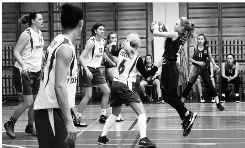
Эпизоды матчей: «Гатчина» – «ТЕХНОЛИНК» (верхний снимок), «СЕВЕРНЫЙ ЛЕГИОН» – «Банк России» (правый снимок)

организации успешно проводят женский чемпионат СЗФО.