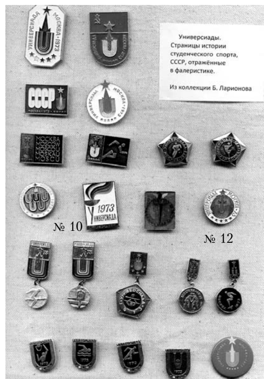
Универсиады. Страницы истории студенческого спорта, СССР, отражённые в фалеристике. Из коллекции Б. Ларионова