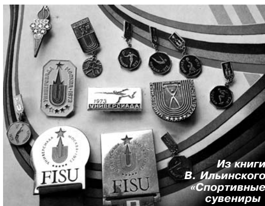
Из книги В. Ильинского «Спортивные сувениры»

Вот о них – по-прежнему именуемых спортивными функционерами казёнными словами: «спортивная атрибутика», – публикуемый материал.