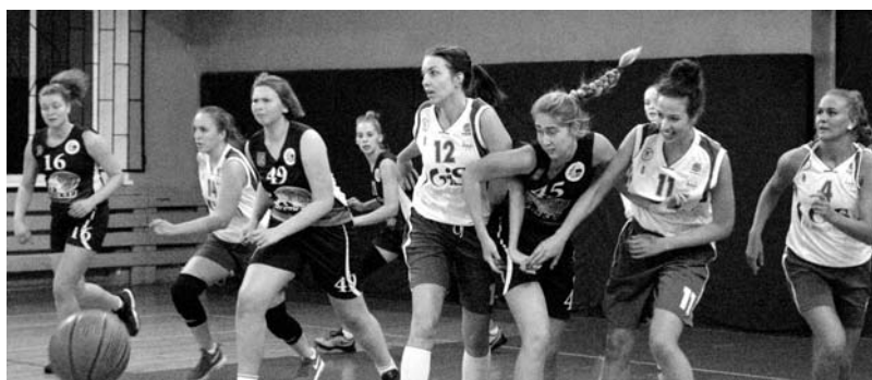
На снимках: эпизоды матчей Невская СДЮСШОР-2 – сборная СЗЛБЛ (вверху) и Кировская СДЮСШОР – Норильск (внизу).