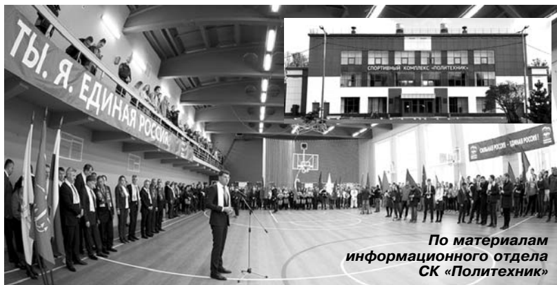
По материалам информационного отдела СК «Политехник»

26 октября в присутствии почётных гостей и, главное, многочисленного отряда студентов СПбПУ Петра Великого состоялось торжественное открытие после двухгодичной реконструкции спортивного комплекса «Политехник».