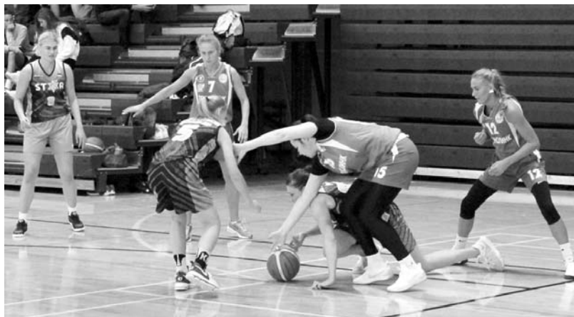
Эпизод матча «ТЕХНОЛИНК» – BC STAR (Эстония)

Поддержку команде оказывает ООО «Специальные технологии»