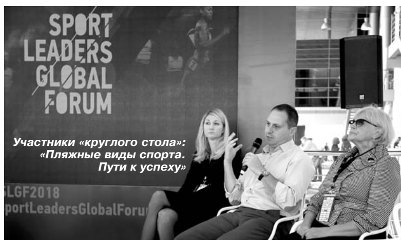
Участники «круглого стола»: «Пляжные виды спорта. Пути к успеху»

просто повезло. Мне друзья в Чехии звонили и упрекали, дескать, я говорил, что «Зенит» очень грозен, а на деле оказалось не так. Но подчеркну, что это впечатление только от одного матча. А вообще мне «Зенит» нравится». «Снова хочу поработать за