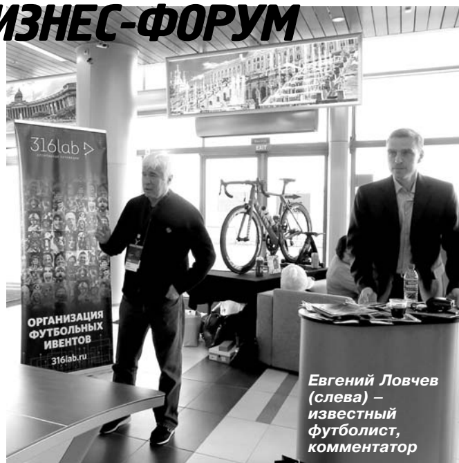
Евгений Ловчев (слева) — известный футболист, комментатор

«Спорт высших достижений: жизнь на пьедестале и вне его», «Лучшие коммерческие активации чемпионата мира по футболу FIFA», «Спортивные медиа: вчера, сегодня, завтра» — эти и другие интересные темы вызвали оживлённые дискуссии,