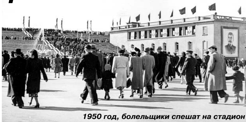
1950 год, болельщики спешат на стадион

Спортивная арена устроена в соответствии с международными правилами и состоит из футбольного поля размером 105x70 метров, беговой дорожки длиной 400 метров и 20-метровой демонстрационной полосы, предназначенной для массовых спортивных соревнований. Общая площадь стадиона около 60 гектаров. Трибуны на 100