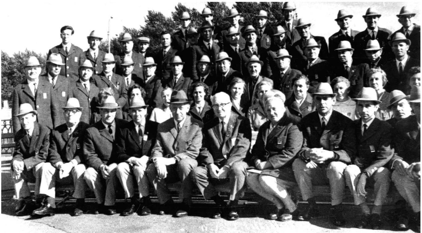
судейская бригада матча СССР – США на стадионе имени В.И. Ленина, 1970 год

«колесо» на идеально «накаченных шинах» и с безупречными «подвесками и рессорами». Такое впечатление вызвал бег спортсмена в тёмно-синей шерстяной «олимпийке» с буквами СССР на груди и в светло-синих непромокаемых «болоньевых» брюках поверх тренировочных (над заполненным до отказа 30-тысячным стадионам не переставая шёл дождь). Это был Валерий Борзов, и это был тот самый образцовый «беговой шаг» – никаких толчков и торможений, подскакиваний, никаких вычурных движений типа постановки ноги с оттянутого носка (перед собой) или фиксации «полного разгибания» ног (сзади себя), акцентированного подъёма коленей, суетливости и сверхнапряжений – просто цельный, гармоничный, красивейший, лёгкий и мощный, плавный и стремительный «накат» или прокат по дорожке, полёт над ней с незаметными мгновенными касаниями... Технически совершенный бег всегда даёт эстетическое наслаждение, и тогда было кем пользоваться в этом искусстве.