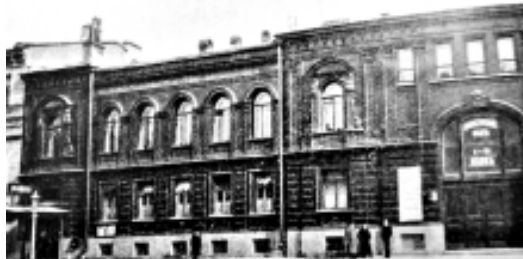
Здание общества «Маяк» на Надеждинской ул., 35 (ныне — ул. Маяковского)

Добавим, что 15/28 декабря 1917 года в «Маяке» открылось отделение для мальчиков со стандартными уроками по гимнастике, в программе которых видное место отводилось под-