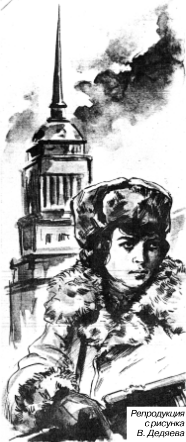
Репродукция рисунка В. Дедяева

К полудню на участке 3-го батальона создалось критическое положение: вражеские танки провалились в его тылы, ещё