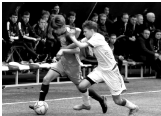
эпизод матча юношеских команд «Зенита» и Беларуси в розыгрыше Кубка дружбы, прошедшего в конце января в манеже «Газпром»- Академии.