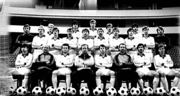
ПКБ «СЕВЕРНОЕ» БАЛТИЙСКИЙ ЗАВОД