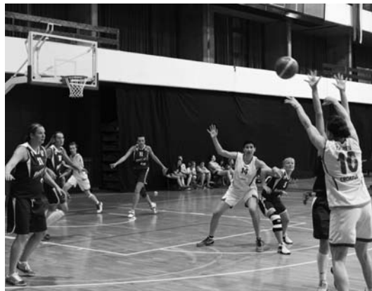
Эпизод матча Хорватия 35 – Россия 30

того, что наша сборная наполовину состояла из игроков из других городов, то совместная подготовка команды была минимальной, и первая игра с Хорватией (35+ вне зачёта) давала нам возможность