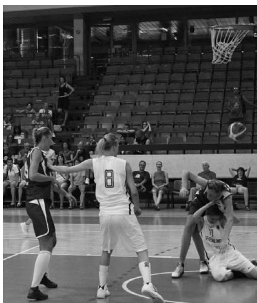
Эпизод финального матча Германия – Россия