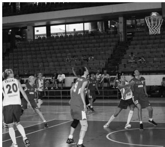
Играют команды России и Украины

посмотреть состав сборной в игровом боевом режиме, а игрокам лучше почувствовать своих партнёров на площадке. Игра закончилась со