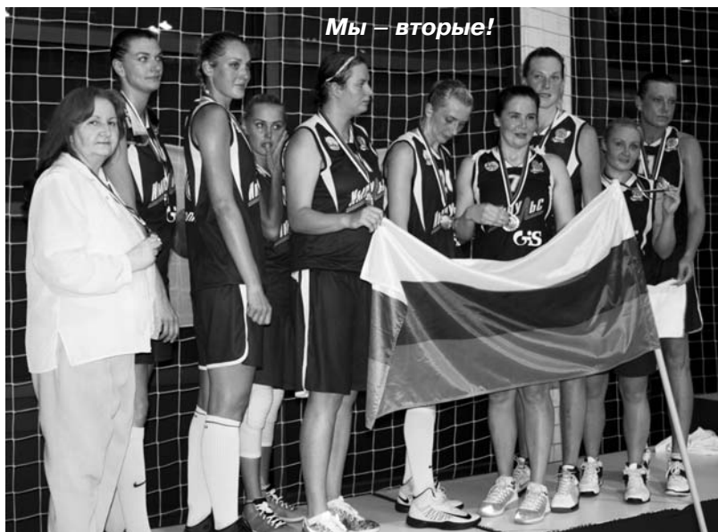
Мы – вторые!

посмотреть состав сборной в игровом боевом режиме, а игрокам лучше почувствовать своих партнёров на площадке. Игра закончилась со