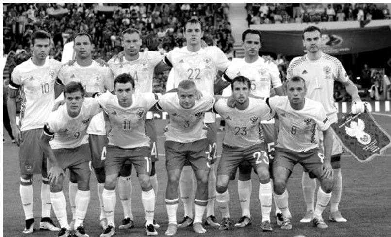
В таком составе (четыре армейца, три зенитовца, по два красnodарца и спартаковца Москвы) национальная сборная начала матч с командой Уэльса

Невнятной, ну, прямо-таки сюрреалистической стала долгая речь Слуцкого после провала. Что-то такое, мол, «я пытался сделать всё возможное», дескать, нужно «чтобы кто-то другой попробовал подготовить команду к судьбоносным для развития футбола в стране стартам», правда, хоть повинился сквозь зубы перед болельщиками, не преминув добавить: «дальше слово за РФС». После встрепенулся Виталий Мутко, также совместитель и в министерском кресле и в ру-