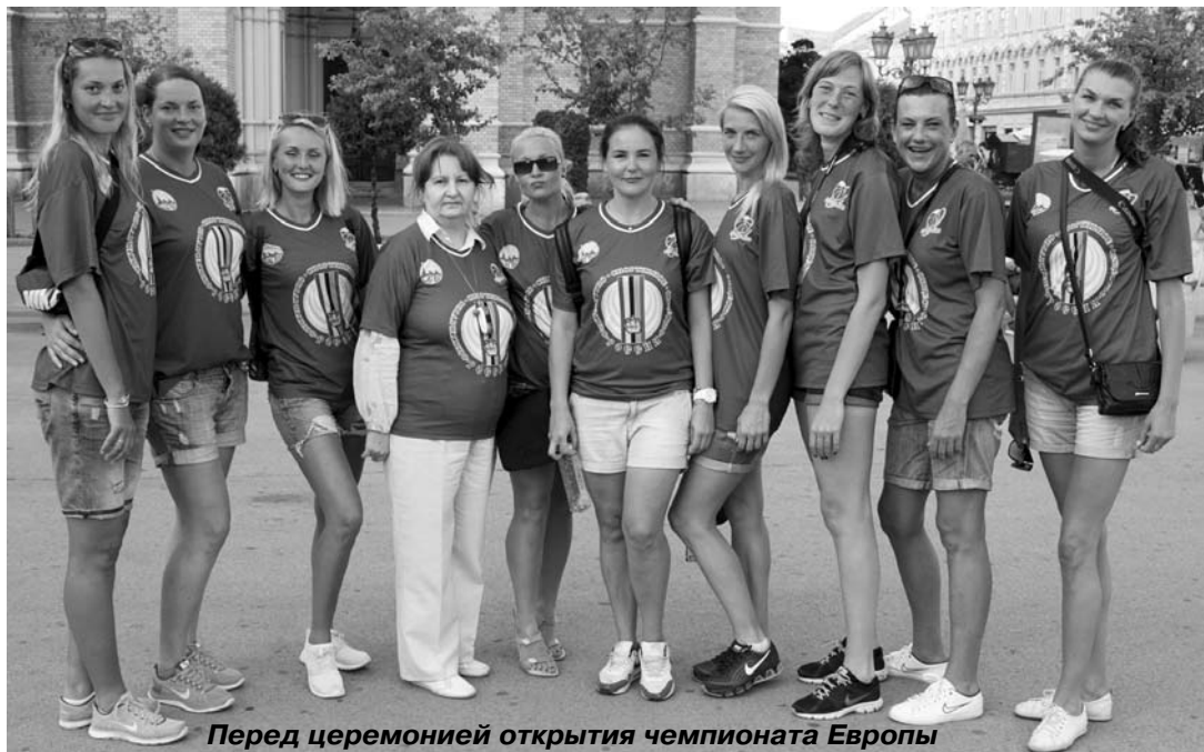
Перед церемонией открытия чемпионата Европы

Через день встреча с Украиной за выход в финал. Эта игра проходила хоть и напряжённо, но с нашим преимуществом. Удалось удачно нейтрализовать разыгрывающего лидера соперников. Соперницы активно начали первый период, вырвавшись вперёд на три очка, но на этом их физический потенциал иссяк. Мы выиграли вторую четверть (+12) и сохранили преимущество в счёте до конца игры – 50:42.