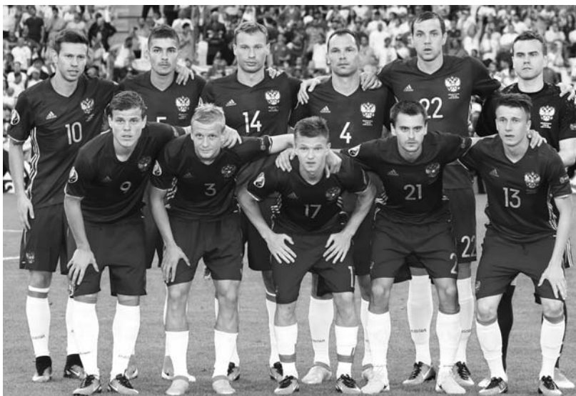
Пятеро армейцев, четыре зенитовца плюс красnodарец и натурализованный немец – в таком составе дебютировала на ЕВРО-2016 сборная России, сыграв вничью с англичанами