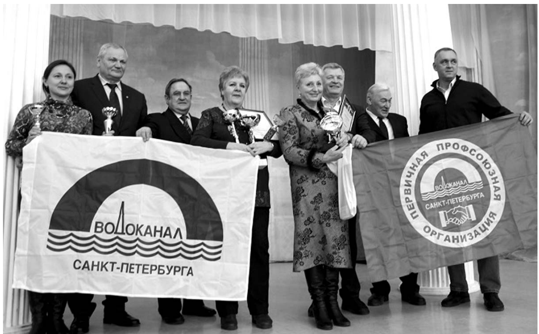
Использованы информация и фото (представителей команд ГУП ТЭК и «Водоканала» вместе с руководителями организаций, проводящих спартакиаду) с сайта ЛФП

В спартакиаде приняли участие 6 территориальных организаций отраслевых профсоюзов. Традиционно самым активным был Межрегиональный профсоюз Санкт-Петербурга и Ленинградской области работников жилищно-коммунальных организаций и сферы обслуживания. За внесённый вклад в развитие спорта профсоюз «коммунальщики», за которым уже давно закрепилось неофициальное звание «самого спортивного в ЛФП» удостоен Почётной грамоты федерации.