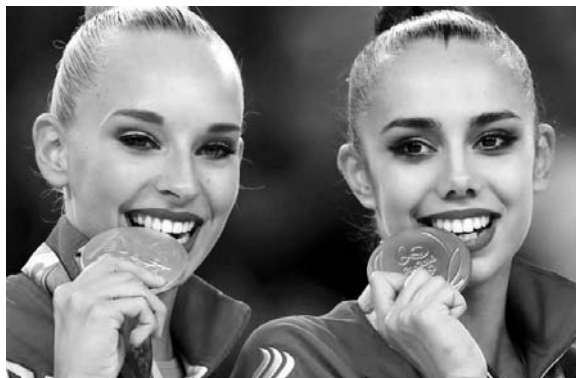
Маргарита Мамун (справа) и Яна Кудрявцева (художественная гимнастика)

Из тридцати девяти наших земляков, выступавших в далёком Рио-де-Жанейро (включая и тех, кто давал Петербургу так называемый параллельный зачёт), олимпийский пьедестал почёта покорили четырнадцать девушек (на их счету по четыре золотых и серебряных медали и шесть бронзовых наград). В активе мужчин с неских берегов, увы, всего одна «бронза».