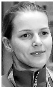
Екатерина Дьяченко (фехтование, сабля)

Как это не удивительно, но спортивный Петербург, как между прочим, и весь Невский край, на Играх XXXI Олимпиады больше всего порадовали представительницы прекрасного, отнюдь не слабого, пола.