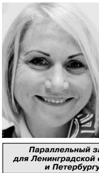
Ольга Забелинская (велоспорт, шоссе)