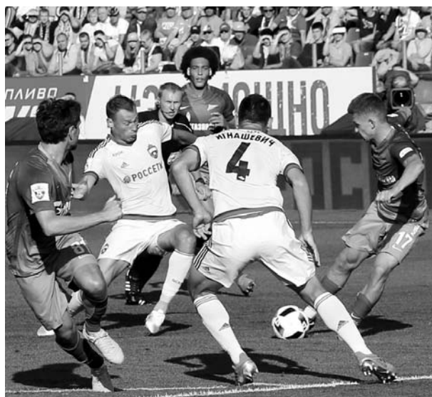
Эпизод матча «Зенит» – ЦСКА (1:1).