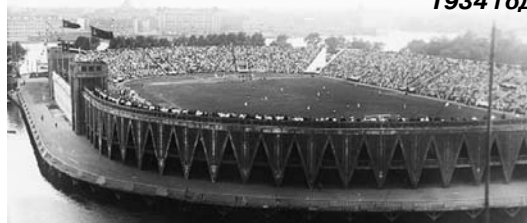
Панорама стадиона им. В.И. Ленина 1934 год

5 июля на футбольном поле состоялся междугородный матч между сборными Ленинграда и Харькова, в котором хозяева на глазах более чем десяти тысяч зрителей победили со счётом 5:1. На следующий день украинцы были биты и второй сборной нашего города – 1:0.